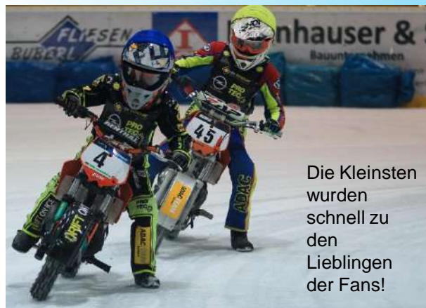
Die Kleinsten wurden schnell zu den Lieblingen der Fans!