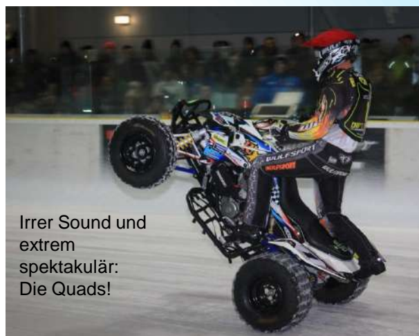
Irrer Sound und extrem spektakulär: Die Quads!